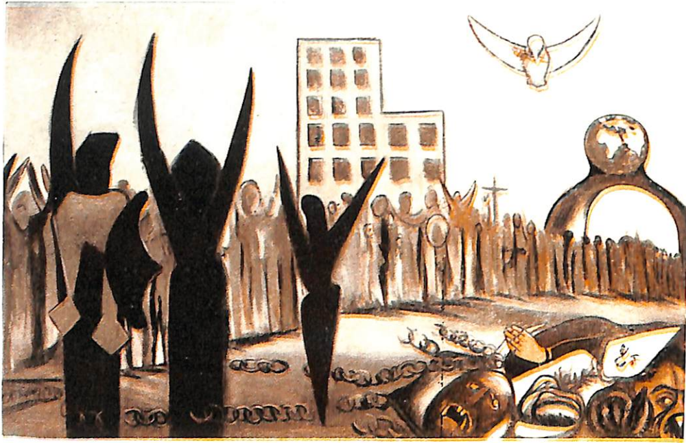
Але Фелеге Селам. Надежда.