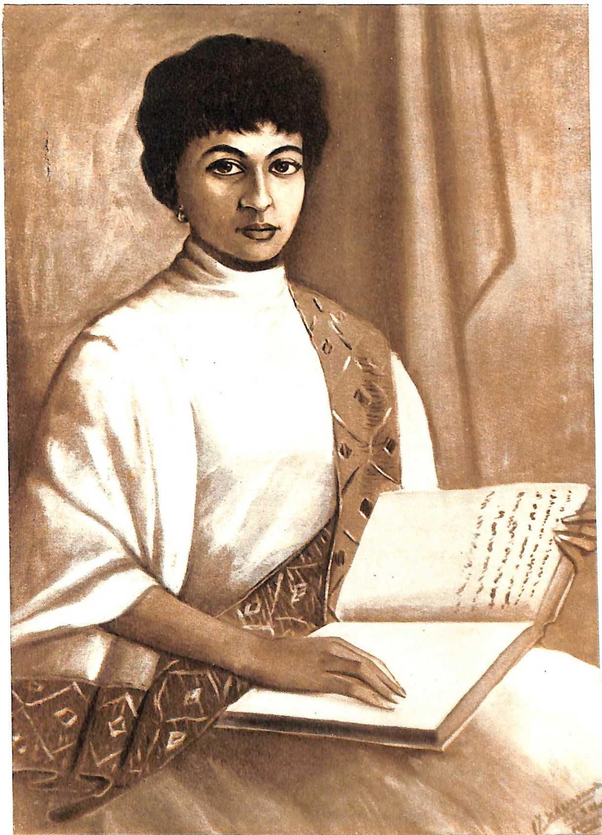
Але Фелеге Селам. Женский портрет.