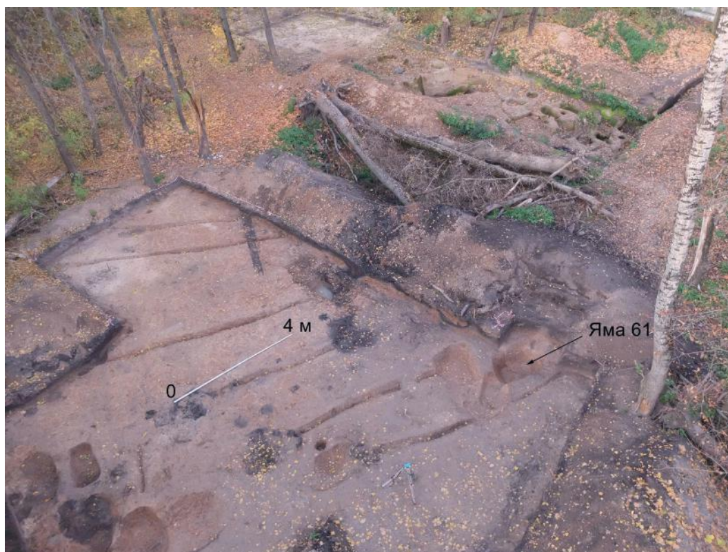
Рис. 7. Раскопы 2018 г. на улице Кашена 15б, стрелка указывает на яму 61, где были найдены отходы стеклоделательного производства.