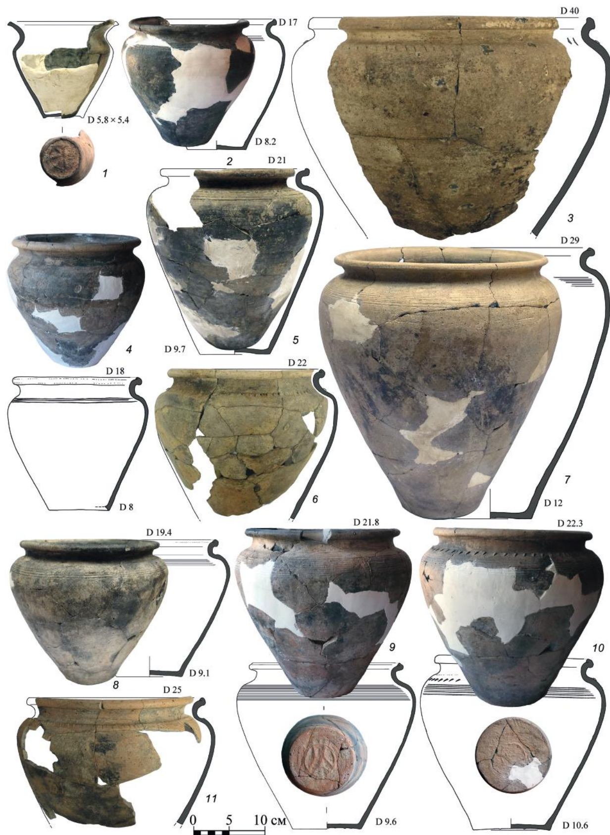
Рис. 5. Горшки XII–XIII вв. (1–11) из раскопов 1 и 2 на улице Кашена 15б.