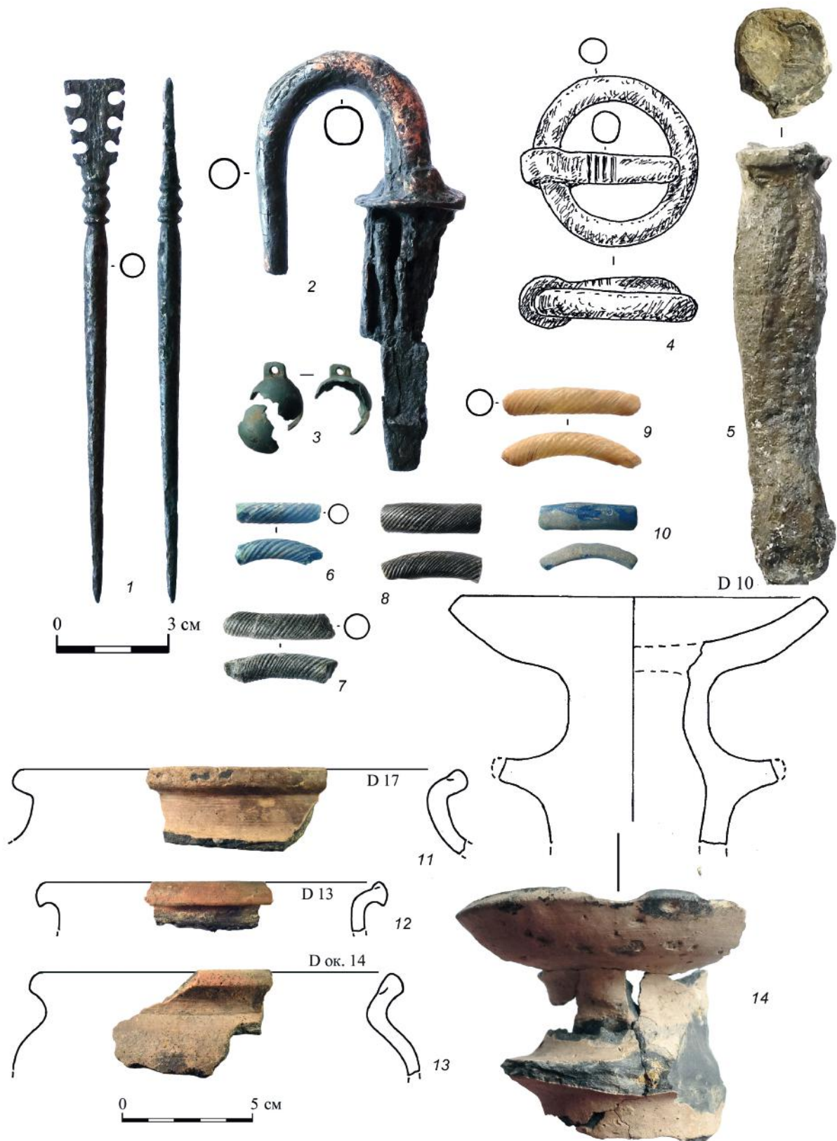
Рис. 3. Находки из раскопок в Новосельцах. 1 – писало из ямы 22; 2 – замок цилиндрический; 3 – бубенчик шелевидный; 4 – пряжка; 5 – чекан; 6–10 – браслеты; 11–13 – керамика из ямы 22; 14 – светильник. 1, 4, 5 – железо; 2 – железо, медь; 3 – бронза; 6–10 – стекло; 11–14 – глина.