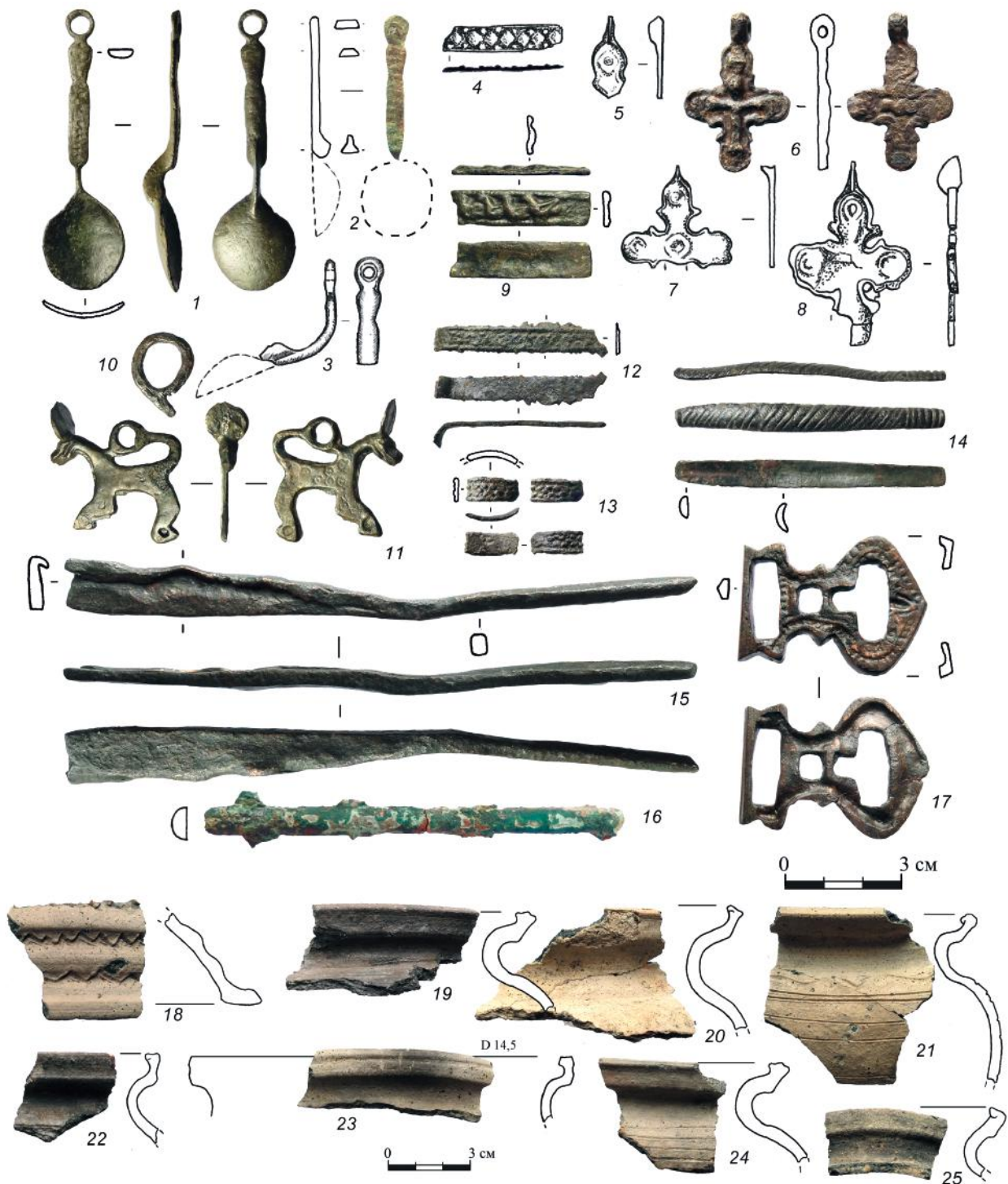
Рис. 2. Находки из ювелирной мастерской второй половины XI в. на Рачевке. Реставраторы П.Г. Дервиз, М.В. Лавриков.

Fig. 2. Finds from the jewelry workshop of the second half of the 11 th century on the Rachevka. Restorers P.G. Derviz, M.V. Lavrikov