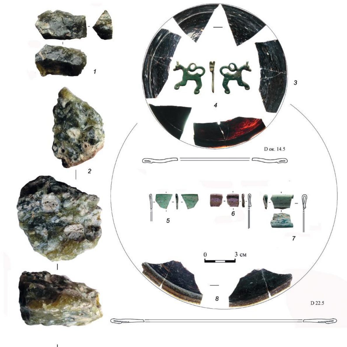
Рис. 6. Отходы стекольного производства и оконницы (1–3, 5–8) – продукция (?) стеклоделательной мастерской в Смоленске, “конек”-левкрота (4), раскоп 2 на ул. Кашена 15б.