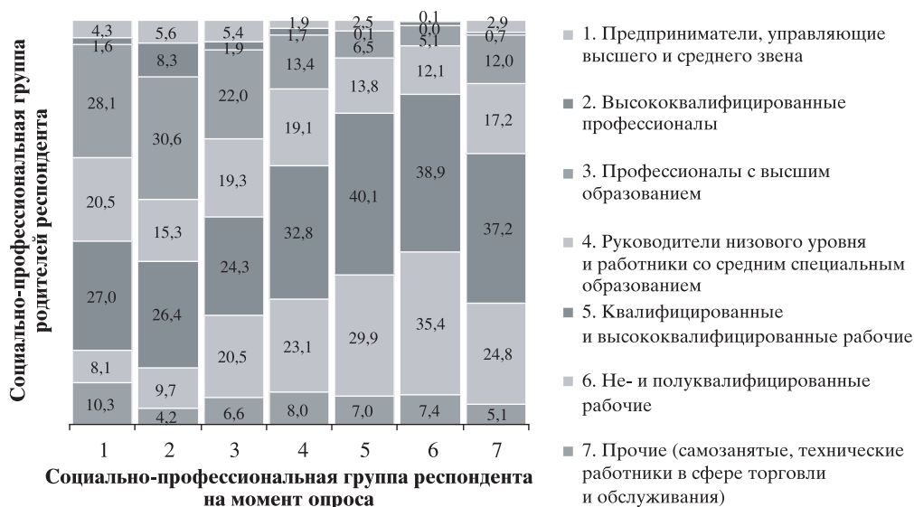
Рис. 2. Социальное происхождение респондентов в возрасте от 30 до 49 лет, принадлежащих к разным социально-профессиональным группам (по данным 2006 г.).

семьи респондента в известной степени оказывает влияние на его жизненные шансы. Однако можно также заметить, что, несмотря на определенные различия, в рассматриваемой структуре отношений “родители–дети” реализуется модель социально-профессиональной структуры общества в целом (см. табл. 1), где наиболее массовые слои представлены рабочими и работниками нефизического труда средней и низшей квалификации.